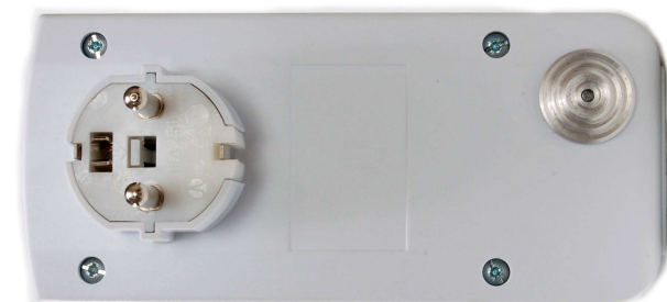
Detail teplotního čidla.

Pro spínání topení v mezích od 20 do 30 stupňů nastavíme TEPLOTA=ANO , TEPLOTAZAP=20 , TEPLOTAVYP=30 , pro klimatizace TEPLOTAZAP=30 , TEPLOTAVYP=20 .